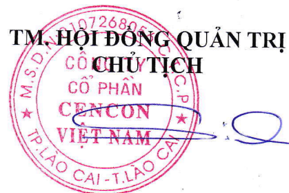
TRẦN MẠNH SƠN